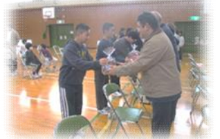
《お世話になった方々へのお礼の会》