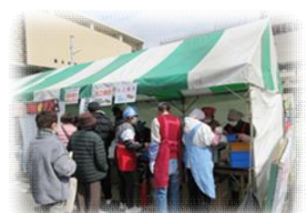
《模擬店 たこ焼き・回転焼き》