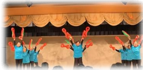
《サークル発表 3B体操シニア》

ご出演、ご出展いただきました皆さま、運営にご協力いただきました皆さまに、心よりお礼申し上げます。