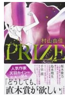
『PRIZE-プライズ-』 村上 由佳