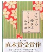
『カフェーの帰り道』 嶋津 輝