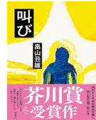
『叫び』 島山 丑雄