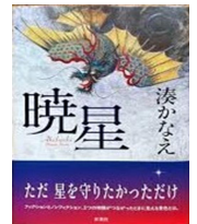
『暁星』 湊 かなえ