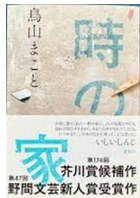
『時の家』 鳥山 まこと