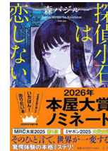
『探偵小石は恋しない』 森 バジル