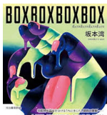
『BOXBOXBOXBOX』 坂本 湾