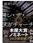
『イン・ザ・メガチャーチ』 朝井 リヨウ