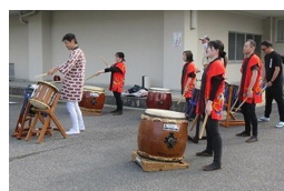
紀州紀ノ川太鼓 の皆さん