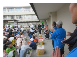
もちまき柱本小学校