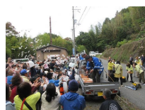
もちまき頂上広場