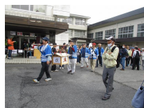
スタンプラリー 参加団体の皆さん