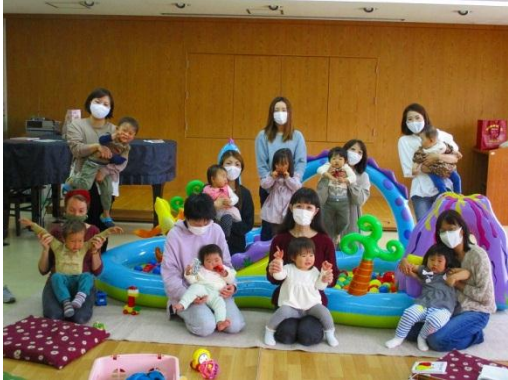
はじめまして 新年度1回目はジャンポプール遊び