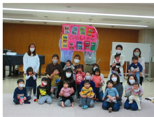
お別れ会 1年間の活動を写真とともに記録しました。