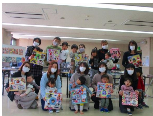
スクラップブッキング 子どもたちの健やかな成長を願って作りました。