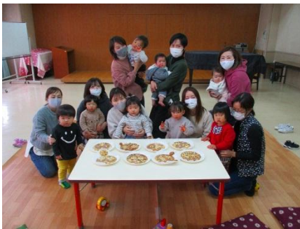
おひな様クッキーを 親子で作りました。 焼き上げた後は持っ て帰り、おうちでの お楽しみに。