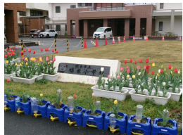
チューリップいっぱい

4月、新入生の下校指導や給食準備のお手伝いに、共育コミュニティの一環で多くのエプロン先生にご協力をいただきました。また18日(土)には、授業参観、学級懇談会、PTA総会を実施しました。