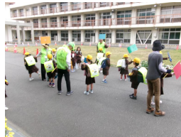
1年生エプロン先生と下校