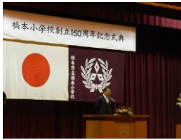
橋本小学校 150 周年記念式典