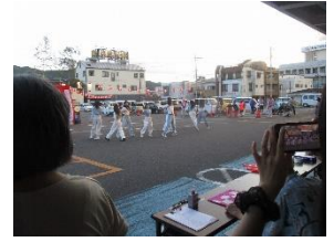
橋本高等学校ダンス部