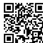
橋小ホームページ QRコード