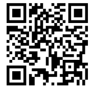
橋小ホームページ QRコード