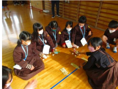
レシニングカー遊び