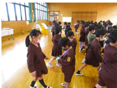
2年生から1年生へメダル進呈