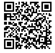
橋小ホームページ QRコード