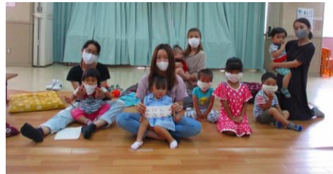
みんなでマスク作り↑