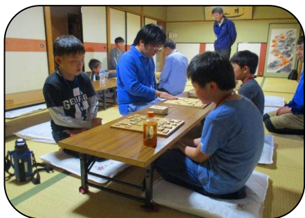
こども将棋教室の様子