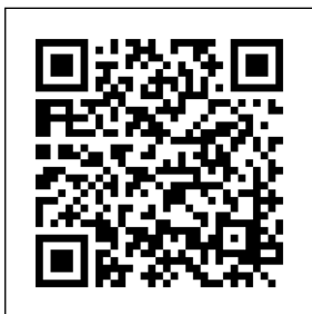
橋小ホームページ QRコード

6月の行事予定も現在のところ未定のことが多い状態です。橋本小学校のホームページ上で随時更新していきますので、ご確認ください。