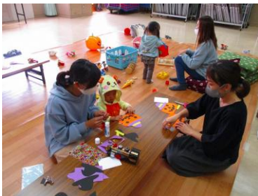
★ハロウィンカードを作ろう