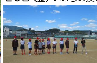
児童会主催全校遊び(増え鬼)