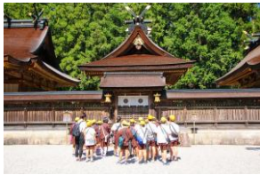
↑熊野本宮 那智の滝→