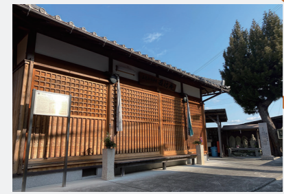
西行法師が生活したと伝えられている、西行法師ゆかりの庵。そばには高野六地藏堂の第一地藏が祀られています。