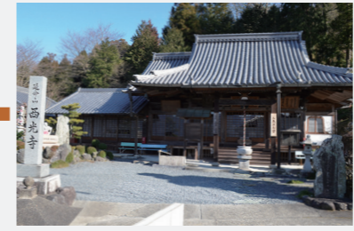
学文路苳萱堂には石童丸の伝説が残っています。他に、夜光の玉など32点の文化財を保有しています。