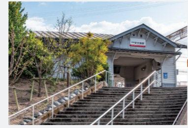
▲青い三角屋根が目印！