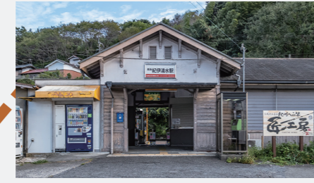
小さくて可愛い外観の紀伊清水駅。ここから旅が始まります！