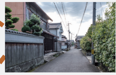
街道を歩けば、東西に蔵のある立派な邸宅が並んでいます。均整を守る窓格子の美しさが一際目を引きまします。静かな古い街並みを見上げながら、古民家ならではの豊かな表情を探してみてくださいいかがですか。