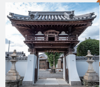
釣鐘がある楼門をかまえた、真言宗の寺院です。