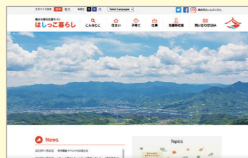
▲ 橋本市移住応援サイト「はしっこ暮らし」