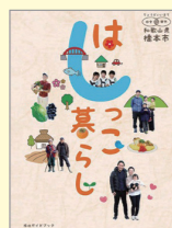
▲ 移住ガイドブック「はしっこ暮らし」

高野街道と伊勢(大和)街道が交わる紀州わかやまの玄関口。世界遺産・高野山の麓で、山河の自然も豊かです。大阪都心部へ約40分という便利さと、田舎暮らしが共存。いなか暮らし派、まち暮らし派にもおすすめの和歌山県のはしっこ暮らし。高野山の麓で自然いっぱいのびのび暮らせるまち。素敵な子育て環境もギョウとあります。