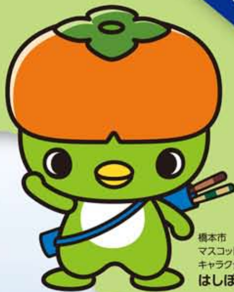
橋本市マスコットキャラクターはしぼう