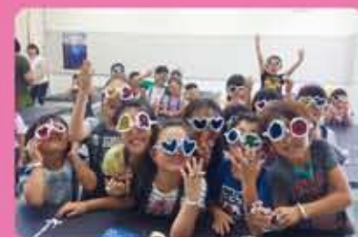
放課後子ども教室