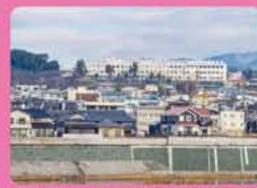
和歌山県立橋本高校 / 古佐田丘中学校(中高一貫校)