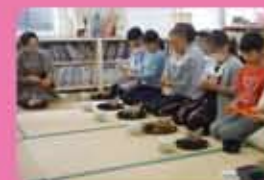
ウィンタースクール(英語)