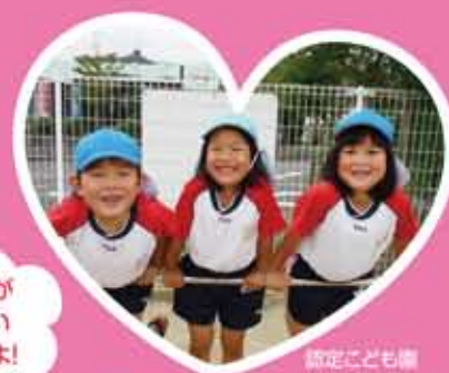
友だちが いっぱい できるよ!