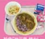
給食「地元産 柳カレー」