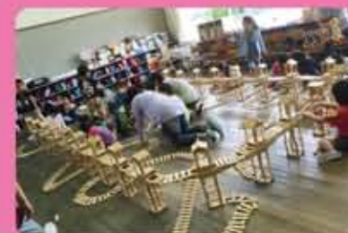
放課後子ども教室