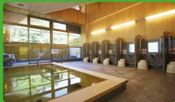
やどり温泉 いやしの湯