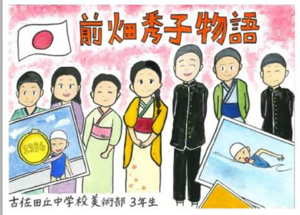
▲紙芝居『前畑秀子物語』表紙