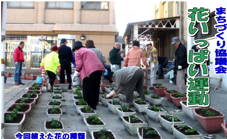
今回植えた花の種類