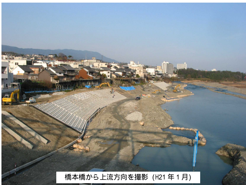
橋本橋から上流方向を撮影 (H21年1月)