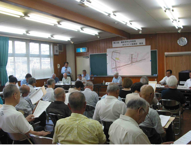
第23回まちづくり協議会総会 (H20.8.10)