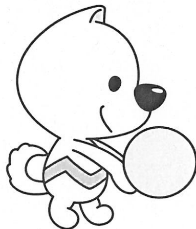
ソフトバレーボール