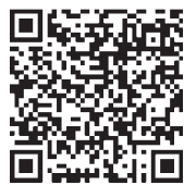
▲登録はこちらから