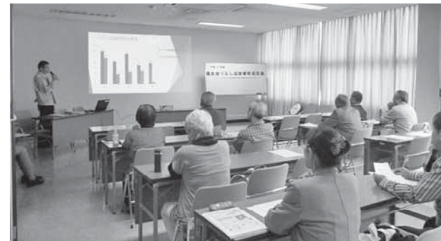
▲くらし応援隊養成講座の様子