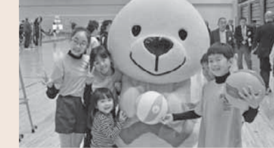
▲ねんりんピックの開催をPRするきいちゃん