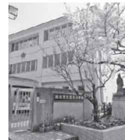
【学校教育課・教育総務課】

信太小学校は、3月末をもって長い伝統に幕を下ろします。地域に支えられて歩んできた歴史と伝統、学びの精神は、今後も市の教育へと引き継いでいきます。閉校にあたり「閉校式」を開催します。また、卒業生で構成する信太小学校閉校プロジェクトなどが主催するセレモニーや写真の展示なども行われます。卒業生をはじめ、皆さんぜひお越しください。