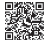
▲携帯電話用二次元コード

子育て家庭の皆さんにさらにわかりやすく見ていただけるように、広報紙で紹介した記事を動画でも配信します。今回は「制作遊び カニの水鉄砲」をYouTube橋本市公式チャンネルに掲載しましたので、ぜひご覧ください。